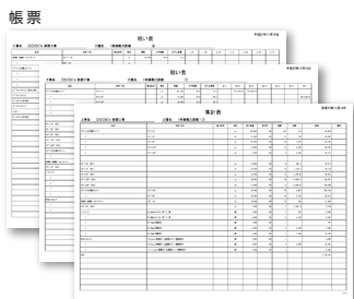
ドラッグ&ドロップ