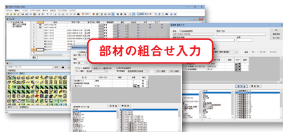
検索ワード入力(品番・型番他)